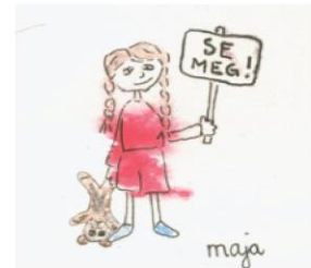
(Я здесь) Рисунок: Maja Michelsen

Будьте собой, таким, какой вы есть. Это значит, что вам на время нужно отложить в сторону ваш профессионализм. Когда вы будете собой, вы позволяете и мне быть собой.